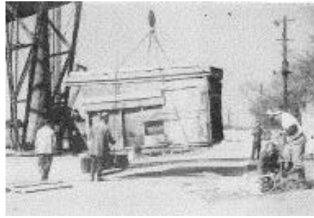
日本国に着陸の一瞬