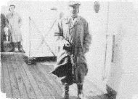
輸入種牡 横浜港到着のスナップ