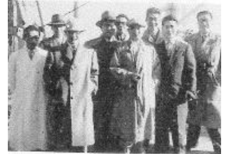
種牡出迎いの岡山県関係者

パブスト・ウォーカー・コバーク 27. 4. 21日生 血統登録 HB第1179282 最優秀牛 全米種牡共進会 1位金メダル受賞 アイオワ州ギルスブラザー牧場育成 ペブスト牧場生産