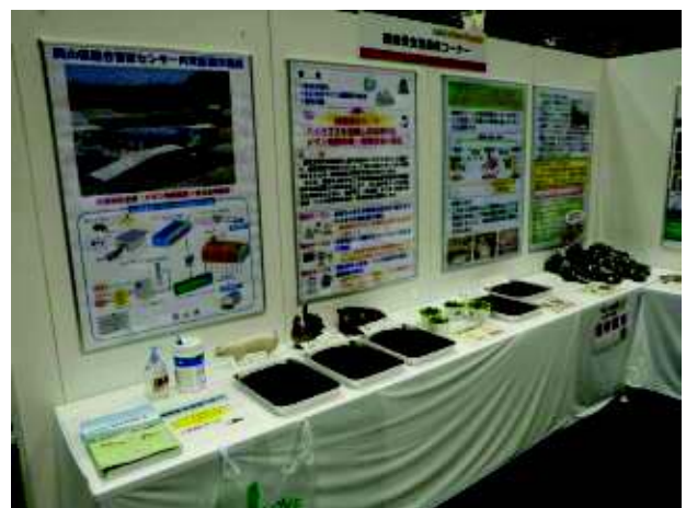
＜エコ&フードフェア2009の畜産課ブース＞

また、農林水産総合センターのブース(テーマ：地球温暖化に対応した農林水産分野の研究)では、農林水産総合センター 畜産研究所で試験を実施しているメタン発酵施設での水素電池発電について、パネルを展示いたします。