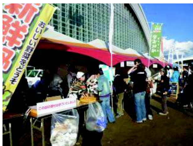
おかやまミルク&ナチュラルチーズフェア 2009での牛乳料理の試食コーナー

各イベントも試食や無料体験等の、楽しい内容を予定しております。平成22年11月6日(土)～7日(日)、10:00～16:00 岡山県総合グラウンドに是非お誘い合わせの上、ご来場ください。