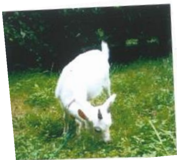
草をいっぱい、いっぱい食べています