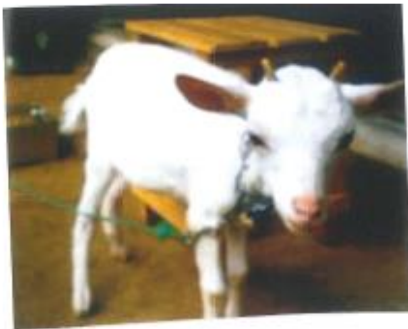
角が生えてきたよ