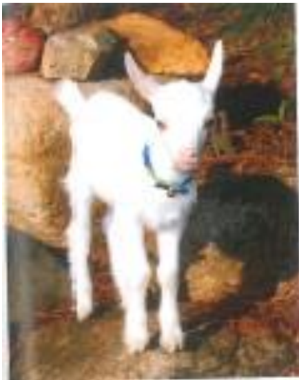
生後 11 日目