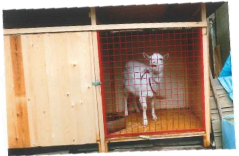
アクビがでたの 失礼しました