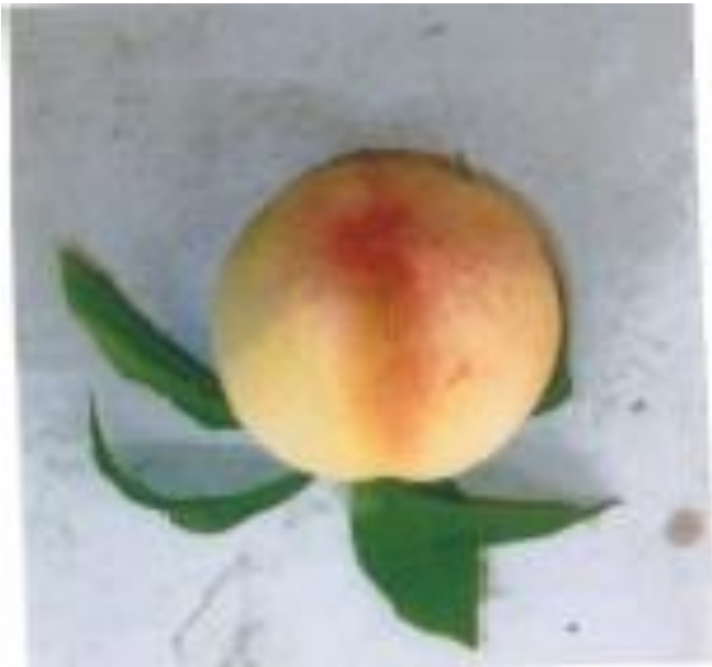
モモは美味しかったです

今日は、山陽町の小坂のおじさんの所でモモをもらって、皮も全部食べました。甘くて、汁が多くて、大変美味しかったです。