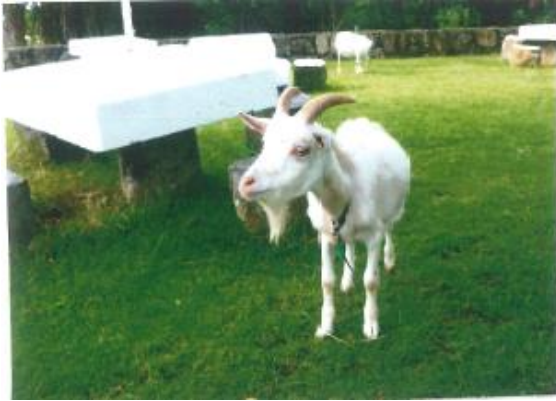
勇氣君 (2015年11月11日生まれ)