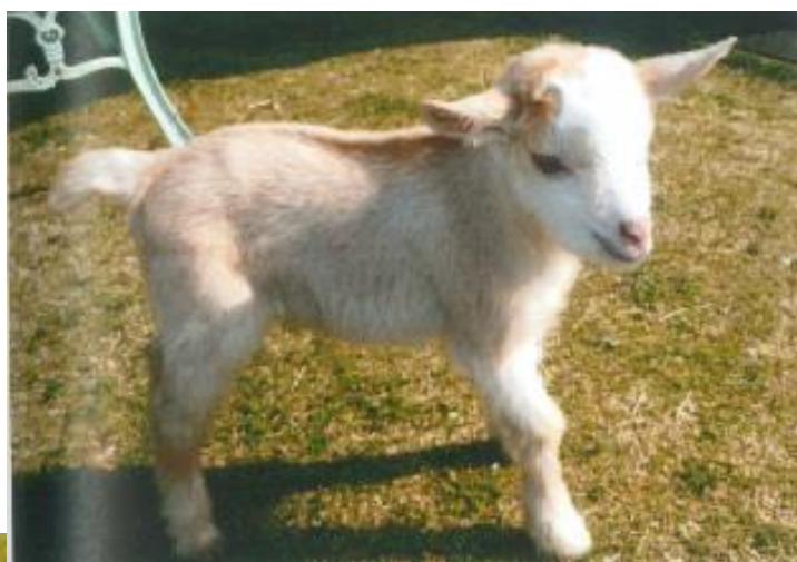
双子の女の子→ （生後3日目）