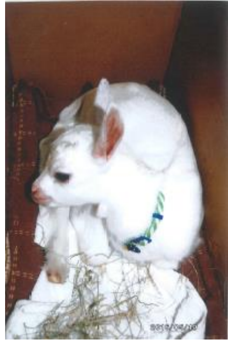
生後 13 日目 タオルで母の温もりを感じている