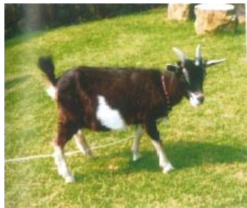
モミジおばちゃんのアカちゃん

八重おばちゃんは、1つ乳が出ないので、獣医さんが雌のあかちゃんを夜の間家に連れて帰って、私と同じように牛用のミルクを飲ませていたようです。