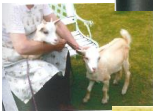
←お客さんとふれあい （生後67日目）