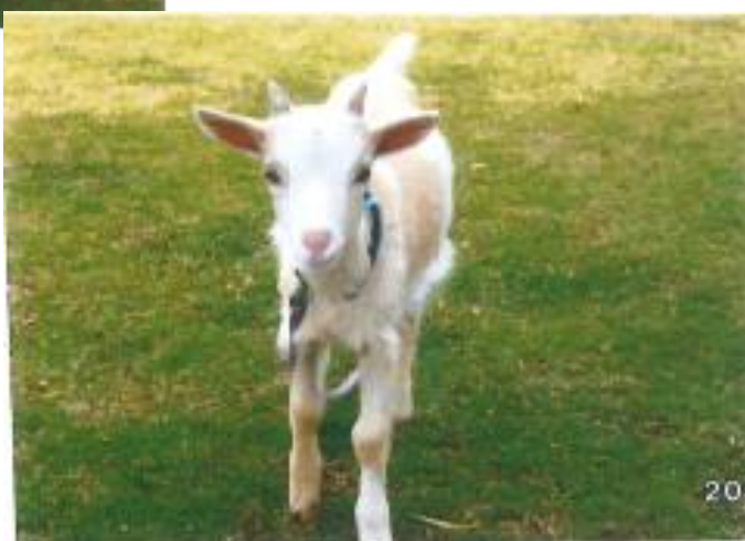
双子の男の子→ （生後67日目） 角が大きくなりました