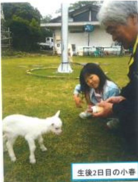
お腹がすいたよ！ ミルクちょうだい！